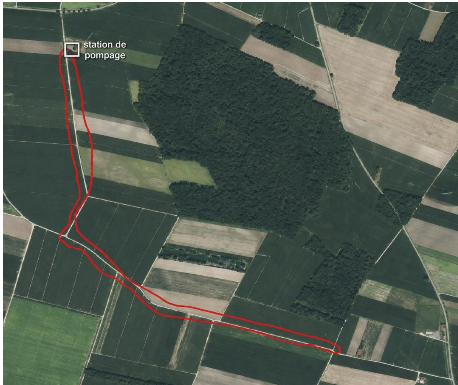
Tracé de la zone de travaux sur le ban de MUSSIG

Ces travaux se dérouleront en route barrée, avec un accès aux riverains, en dehors des heures d'intervention de l'entreprise.